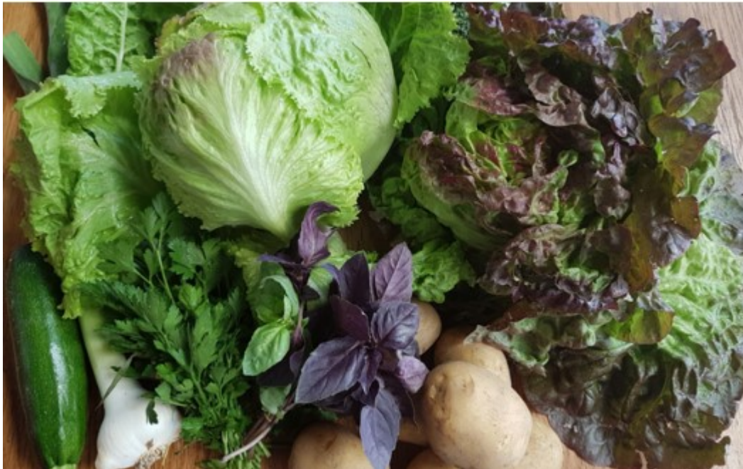
Bild: Gemüse vom www.visionbirchhof.ch